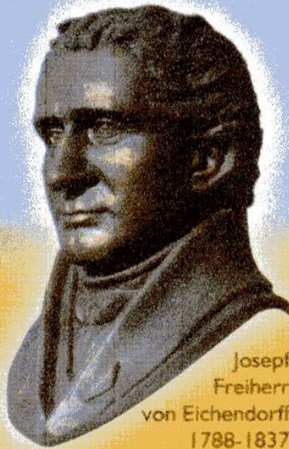
Josef Freiherr von Eichendorff 1788-1837

Oberschlesisches Eichendorff- Kultur- und Begegnungszentrum in Lubowitz